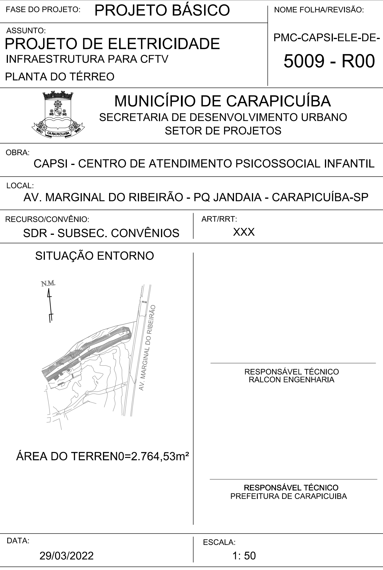
INFRAESTRUTURA PARA CFTV - PLANTA - TÉRREO Escala: 1:50